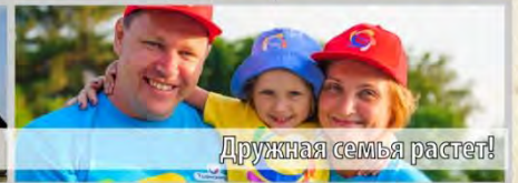
Дружная семья растет!