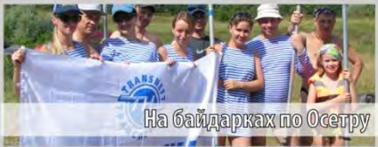
На байдарках по Осетру